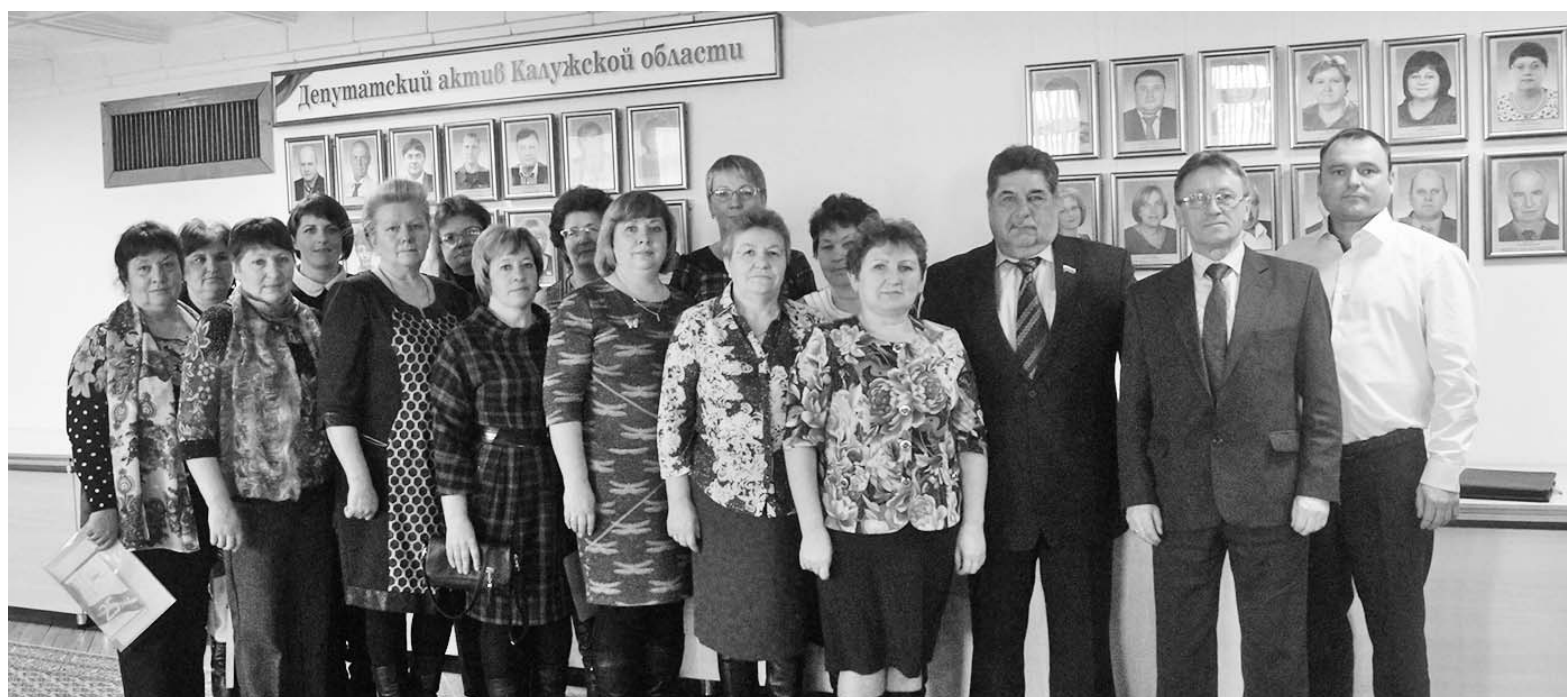
Делегация Думиничского района.