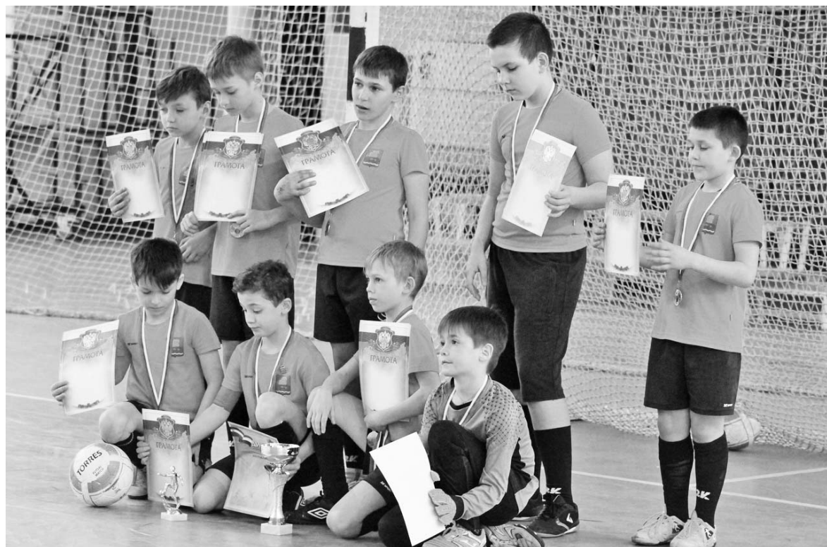
Турнир был напряженным, и все немного устали...